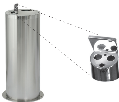
SLUN 23E, SLUN 23EB